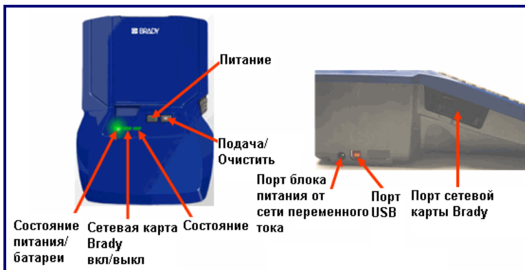
Рис. 1. Внешний вид принтера BMP®53

Переносной принтер BMP®53 — это периферийное устройство, предназначенное для печати этикеток и файлов этикеток, созданных на ПК, планшетах, переносных устройствах или смартфонах с использованием соответствующего программного обеспечения, например LabelMark™ Labeling Software или Brady Mobile Software. Этикетки и файлы этикеток передаются на принтер по кабелю USB, либо через подключение Bluetooth или WIFI при использовании сетевой карты Brady.